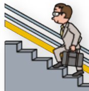
階段を上る 10分 = 65kcal