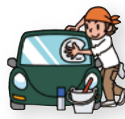
洗車をする 30分 = 142kcal