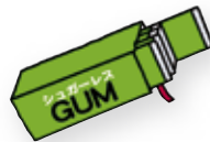
シュガーレスガムや キャンディ・タブレット

口寂しさを紛らわせる食べ物に注意する！ デスク周りに低カロリーの食べ物を数種類準備