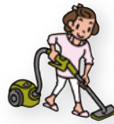
掃除機をかける 15分 = 39kcal